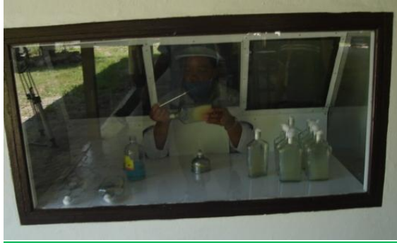
เปียเชื้อเห็ดลงในอาหาร สูตร PDA