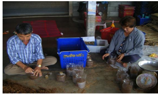
บรรจุสูตรอาหารทำก้อนเชื้อ