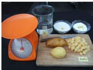
- ปอกเปลือกและหั่นมันฝรั่ง เป็นชิ้นขนาดลูกเต๋า(1 ลบ.ซม.)