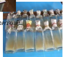
- เอียงขวดเพื่อเพิ่มพื้นที่ผิว