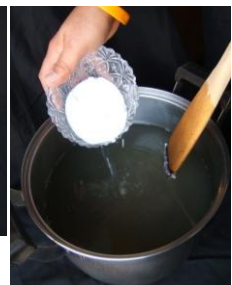
- ใส่น้ำตาล