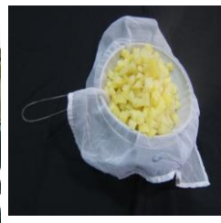
- กรองเอาแต่น้ำ