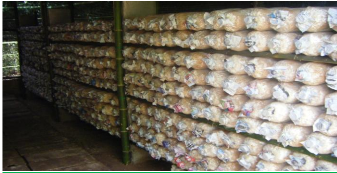
นำก้อนเชื้อวางในโรงเรือน