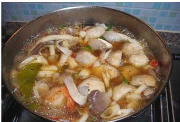
ต้มยำเห็ด