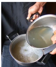
- ผสมก้อนและน้ำมันฝรั่ง