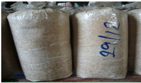
เส้นใยเจริญเต็มที่