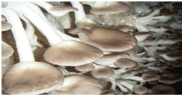
เก็บผลผลิต