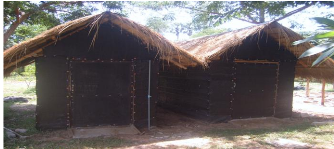
โรงเรือนเปิดดอก