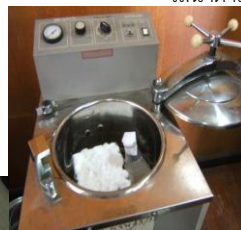
- ینگ่าเชื้อในหม้อนึ่งความดัน