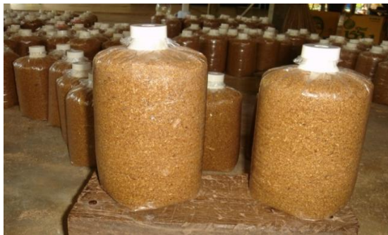
ก้อนเชื้อที่ดี