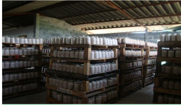
ตั้งก้อนเชื้อเพื่อให้เส้นใยเจริญ