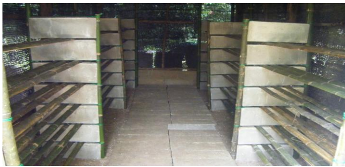
ชั้นวางภายในโรงเรือน