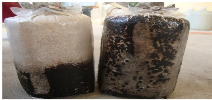
โรคและแมลงที่อาจเกิดขึ้น