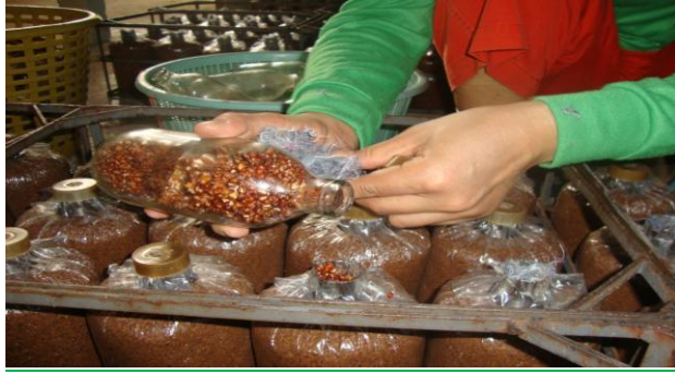
ถ่ายหัวเชื้อเม็ดข้างฟางลงก้อนเชื้อ