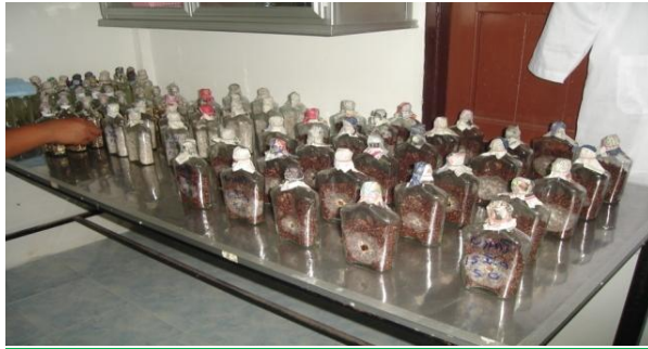
เลี้ยงเส้นใยเห็ดในหัวเชื้อข้าวฟ่าง