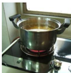
- ต้มไฟอ่อนจนสุก