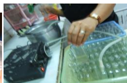
- กรอกใส่ขวด