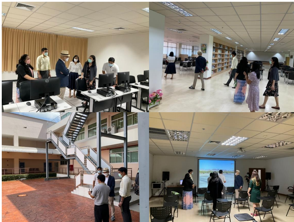
คณะกรรมการตรวจประเมินฯ เยี่ยมชม ห้องสมุด ห้อง LBT ห้องเรียน และสิ่งสนับสนุนการเรียนรู้อื่นๆ