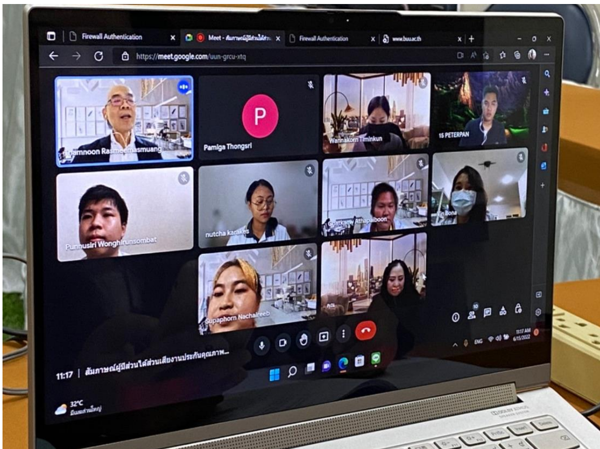
คณะกรรมการตรวจประเมินฯ สัมภาษณ์นิสิตทุกชั้นปี