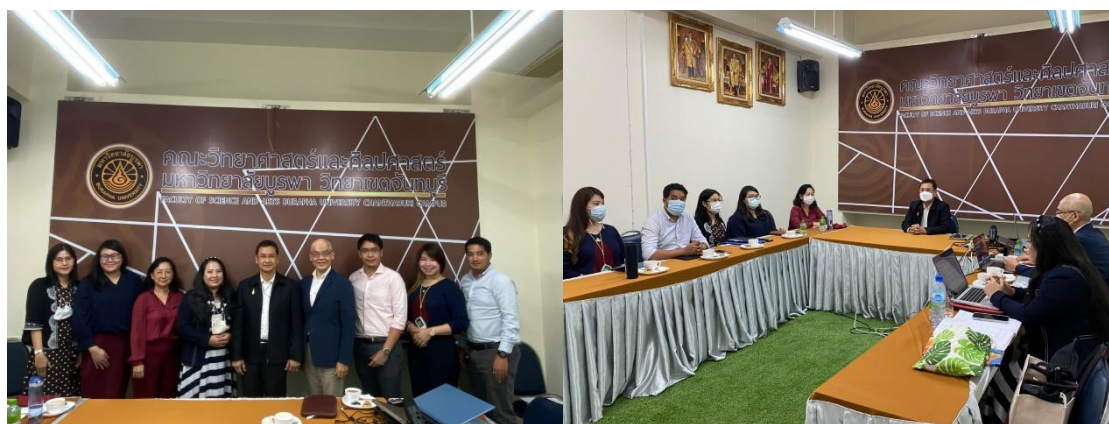
คณะกรรมการตรวจประเมินฯ นำเสนอข้อค้นพบที่สำคัญ (จุดแข็งและโอกาสที่ควรพัฒนา) สอบถามความเห็นจากหลักสูตรเกี่ยวกับข้อค้นพบ และแจ้งผลการตรวจประเมิน