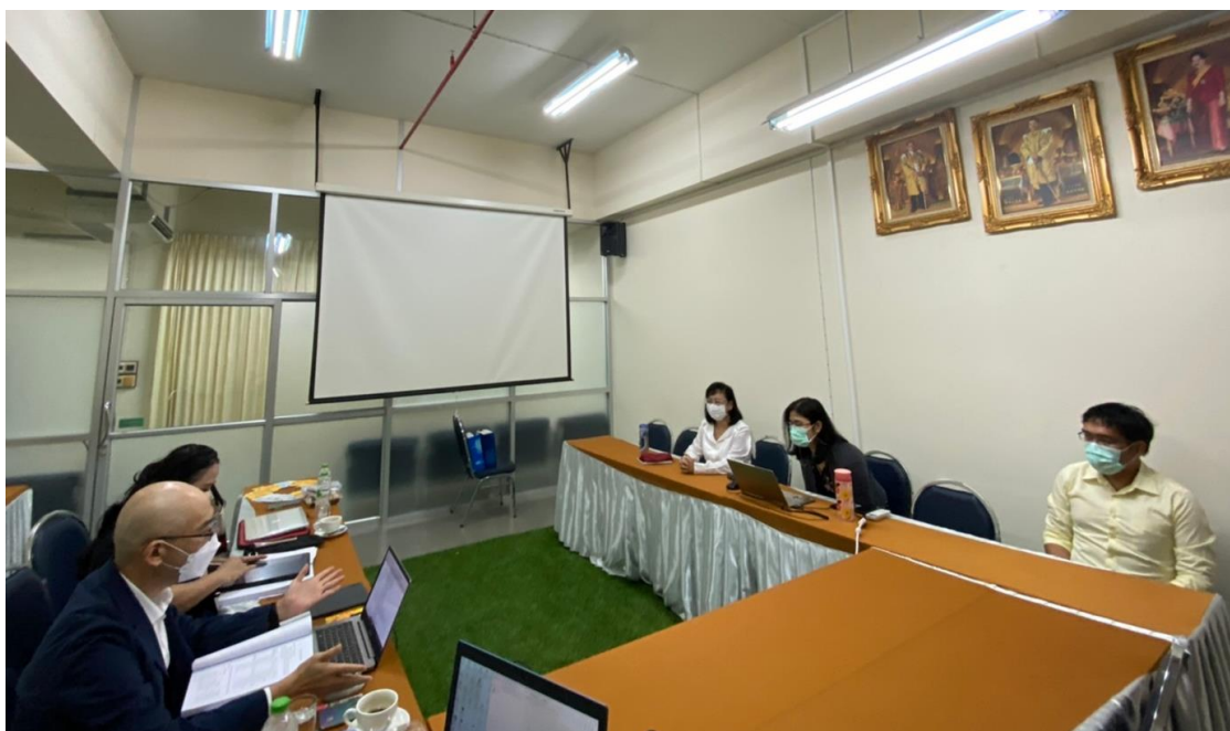
ประธานหลักสูตรนำเสนอภาพรวมผลการดำเนินงานของหลักสูตรต่อคณะกรรมการตรวจประเมินฯ