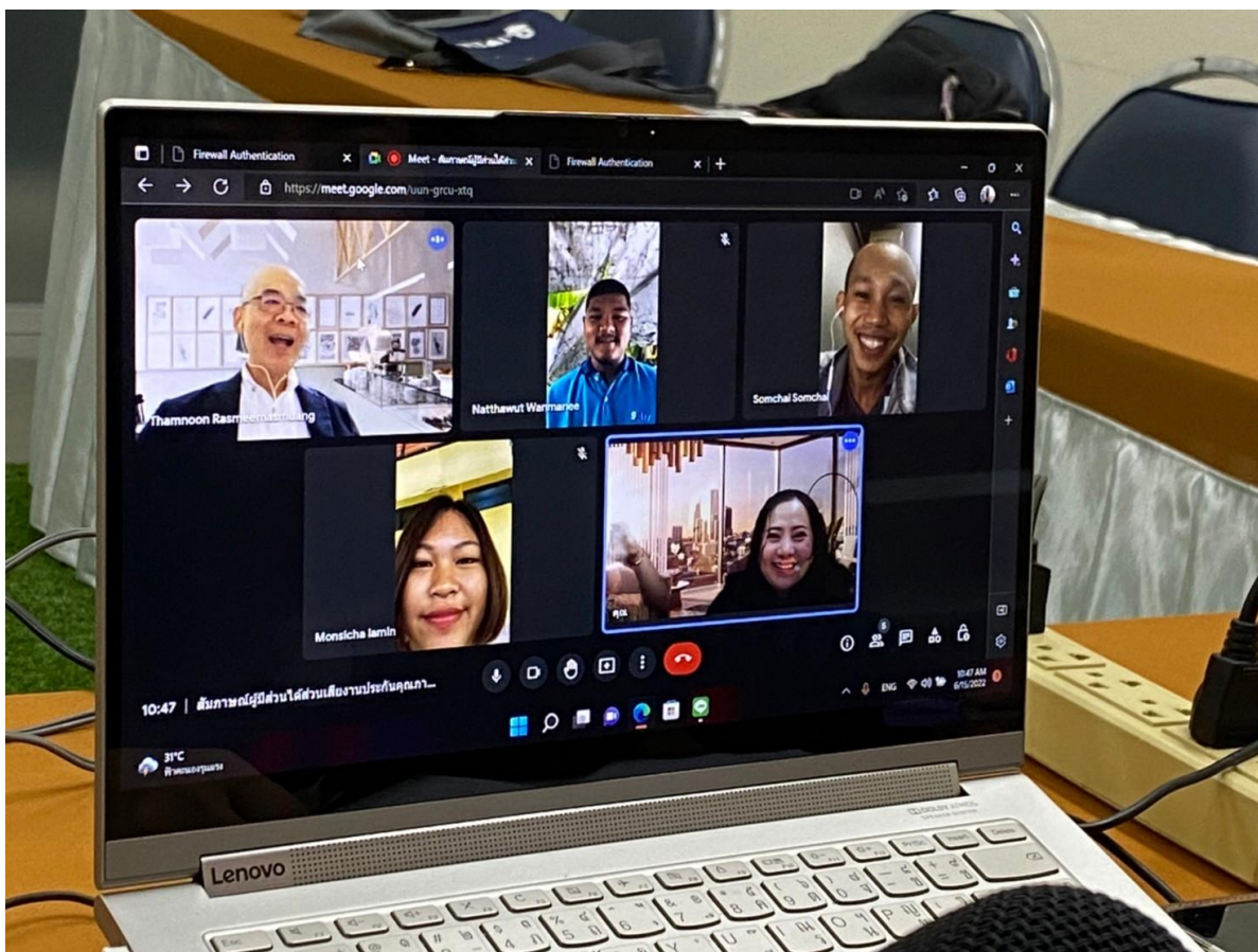
คณะกรรมการตรวจประเมินฯ สัมภาษณ์ศิษย์เก่า