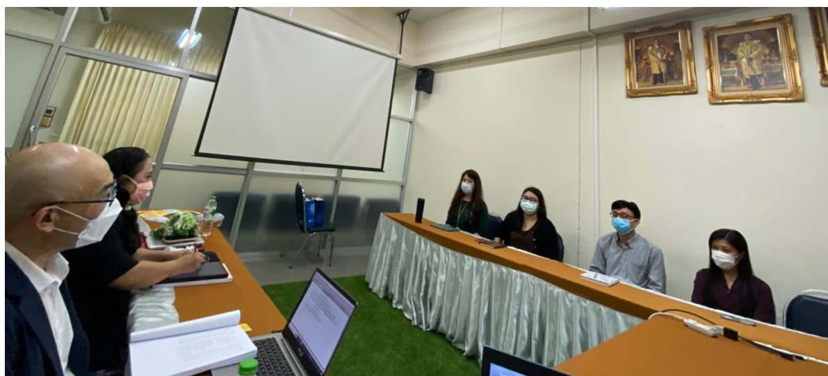
คณะกรรมการตรวจประเมินฯ สัมภาษณ์อาจารย์ผู้สอน