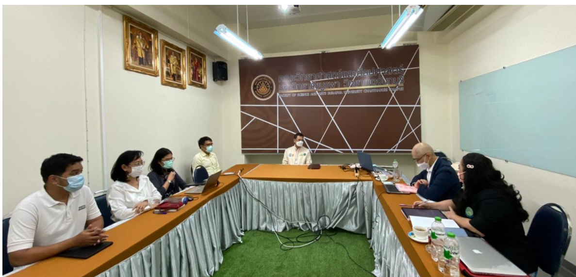
คณะกรรมการตรวจประเมินฯ สัมภาษณ์ตัวแทนผู้บริหารและอาจารย์ผู้รับผิดชอบหลักสูตร