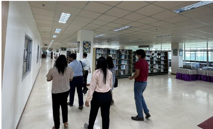
รูปที่ 2 คณะกรรมการเยี่ยมชมสิ่งสนับสนุนการเรียนการสอน