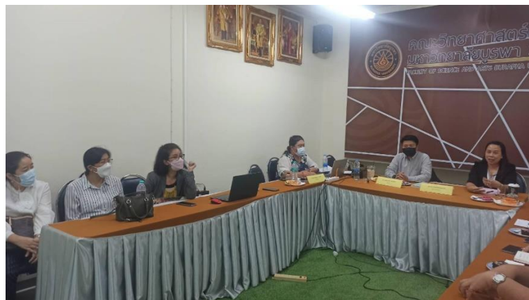
รูปที่ 3 คณะกรรมการเสนอข้อค้นพบที่สำคัญและแจ้งผลประเมินต่อหลักสูตร