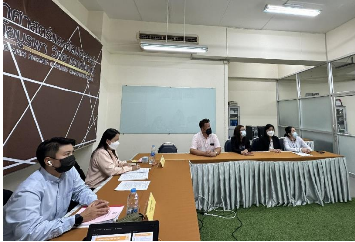
รูปที่ 1 ประธานหลักสูตรบรรยายสรุปภาพรวมของหลักสูตร